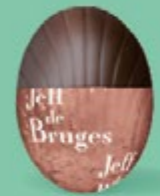
Praliné et noix de coco caramélisée