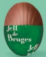
Praliné et éclats de crêpe dentelle