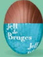
Ganache chocolat noir Équateur