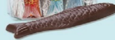
Chocolat noir 60% de cacao et éclats de crêpe dentelle