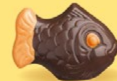
Praliné croustillant aux éclats de crêpe dentelle