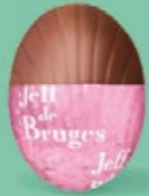
Praliné noisettes façon pâte à tartiner