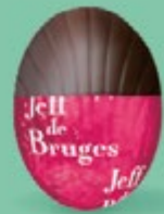
Praliné et éclats de noisettes caramélisées