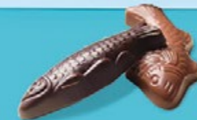
Chocolat au lait 36% de cacao