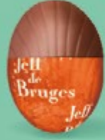
Praliné avec sucre pétillant